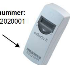
Modell 202 S: